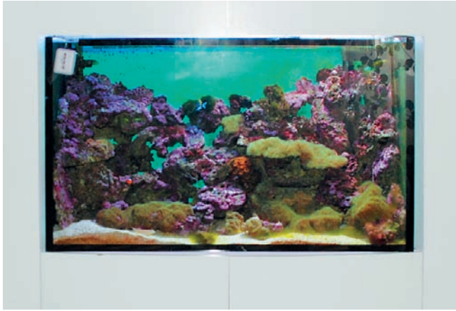
Blickfang – das Meerwasseraquarium mit lebenden Korallen