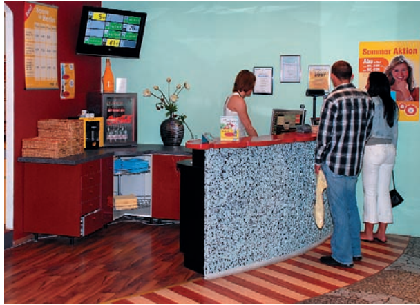
Der Eingangsbereich des Studios