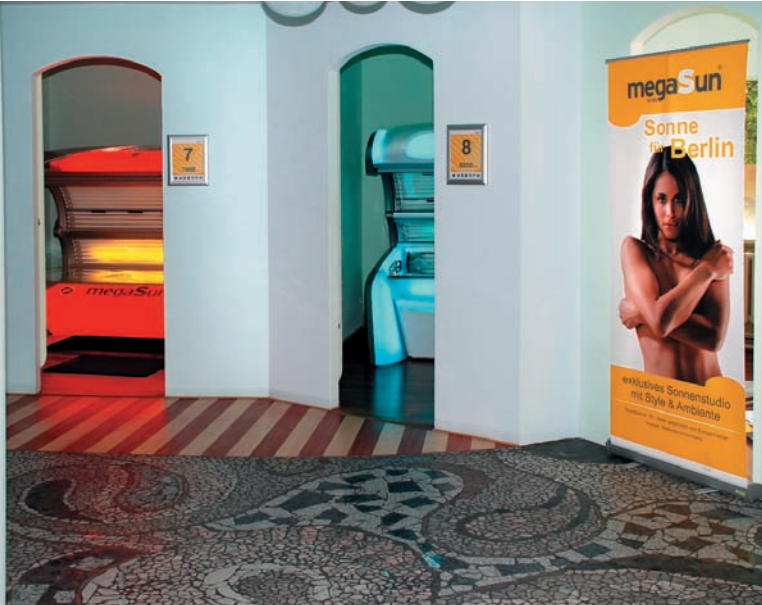
Der Boden im Berliner megaSun ist ein wahres Kunstwerk