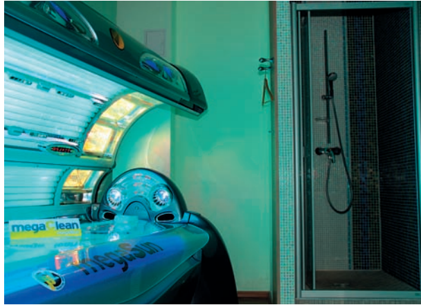
Die meisten Kabinen sind mit Duschen ausgestattet